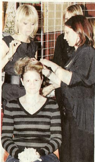
Démonstration de coiffure en vue du défilé de l'après-midi.

Pour Sylvie et Anthony, venus de Lembach avec leur pe-